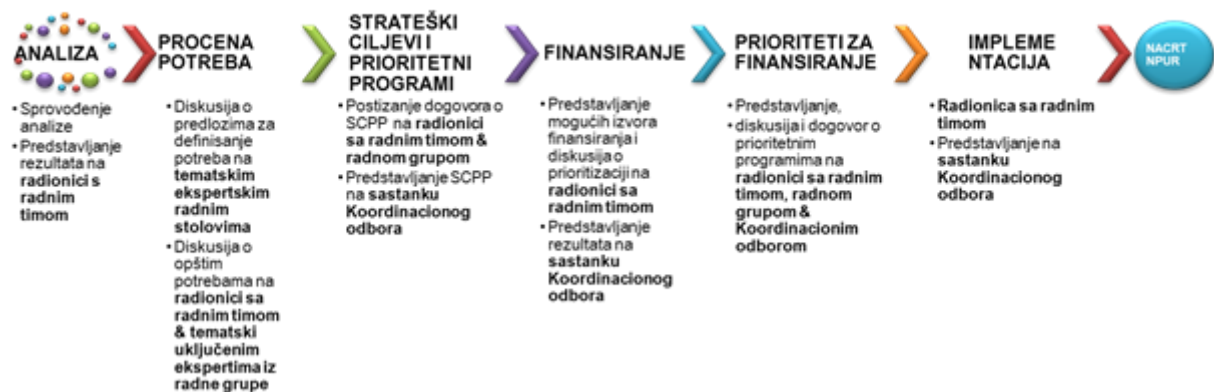
Шема 2: Кораци у процесу - радионице, округли столови, састанци