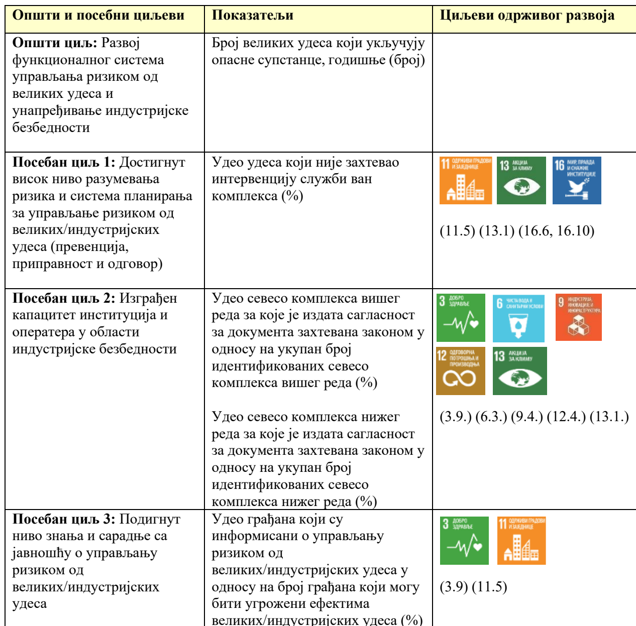
Табела 6.2. Преглед доприноса циљева Програма циљевима одрживог развоја Агенде 2030

Спровођење Агенде 2030 и остваривање изабраних Циљева одрживог развоја (ЦОР 3, 6, 9, 11, 12, 13 и 16) у директној је вези и са испуњавањем четири приоритетне области Оквир за смањење ризика од катастрофа из Сендаја за период 2015-2030. године, јер обе агенде промовишу отпорност, одрживост, добробит становништва и јачање институционалних капацитета за управљање ризицима.