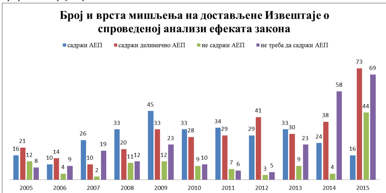
Графикон 1. Број и врста мишљења

Предуслов за спровођење квалитетног процеса анализе ефеката прописа је детаљна анализа постојећег стања. Органи државне управе врше праћења стања у области као један од основних послова државне управе. У пракси се утврђивање постојећег стања врши селективно, а чак и када се стање у области ажурно прати, прикупљени подаци о стању се ретко систематски прикупљају, обрађују, анализирају и објављују. У том смислу, при спровођењу анализе ефеката прописа у дефиницији проблема који се желе решити, па самим тим и у дефинисању циљева доношења закона, у одређеним случајевима изражена је арбитарност министарстава у погледу дефинисања разлога за доношење конкретног закона. Додатни проблем је што у недостатку података о стању у областима, у спровођењу ех ante анализе је тешко извршити компаративну анализу трошкова и користи који се односе на привреду и грађане. У правном и институционалном систему Републике Србије не постоји континуирана контрола спровођења обавезне ех post анализе јавних политика и прописа којима се ове политике спроводе, те чак и када министарство води сврсисходно праћење стања у области, подаци нису увек доступни државним службеницима који спроводе анализу ефеката конкретног нацрта закона. Обавеза израде ех post анализа и њена доступност свим званичним предлагачима прописа и докумената јавних политика би допринела квалитетнијом разрадом опција за решавање проблема и значајно би унапредила процес израде и праћења прописа и других јавних политика.